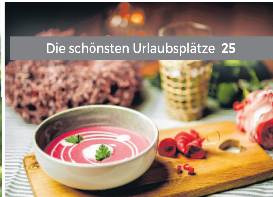
Die schönsten Urlaubsplätze 25