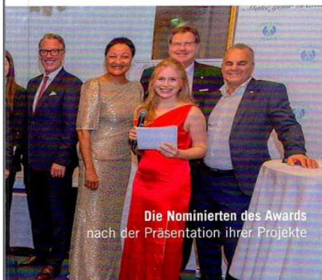
Die Nominierten des Awards nach der Präsentation ihrer Projekte

Wir gratulieren herzlich allen Gewinnern und empfehlen den Gesamtüberblick auf der Webseite www.health-spa-award.com/de/gewinner/ !